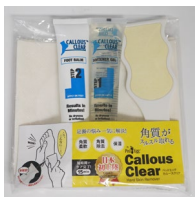
コンプリートパック