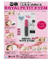
ふたえの作り方POP※中国語版も有り