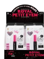
商品はこちらの6個箱に入れて納品いたします。