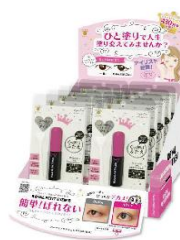
W190(リーフレット50枚・スイングPOP付)