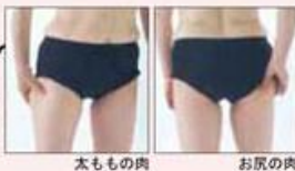
太ももの肉 お尻の肉

多くの女性が悩んでいる脚まわりの余分な脂肪。その原因は運動不足はもちろん、ゆがんだ姿勢、仕事、歩き方による筋肉の低下にあり、放っておくとどんどん脚を太くしてしまいます。パンツスタイルも決まる美脚ラインを生み出すためにも、太もも全体をキュッと引き締め、筋肉を鍛える必要があります。