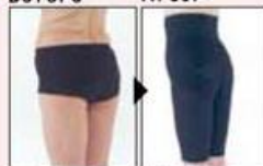
太ももからひざ上まで全体的に包み込むので、同時にパンツスタイルも似合う美脚に。